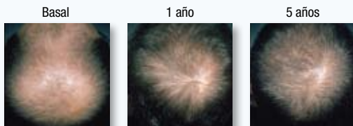
PACIENTE 1: GRAN AUMENTO