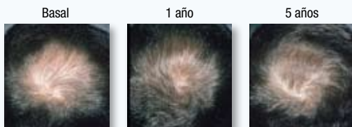
PACIENTE 2: AUMENTO MODERADO