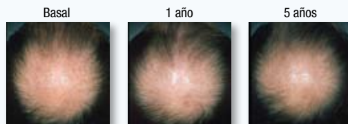
PACIENTE 3: AUMENTO LIGERO