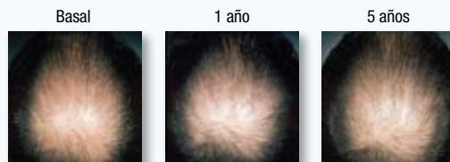
PACIENTE 4: SIN CAMBIO (SIN CAÍDA ADICIONAL DE CABELLO)

El crecimiento del cabello ha sido clasificado por un grupo de dermatólogos expertos en cada momento. Puede haber diferencias en los resultados individuales.